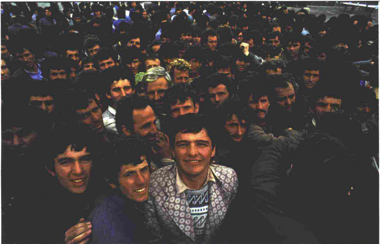
Migliaia di ragazzi, anche molti minori non accompagnati, raggiungono Brindisi su mercantili e pescherecci il 7 marzo del 1991