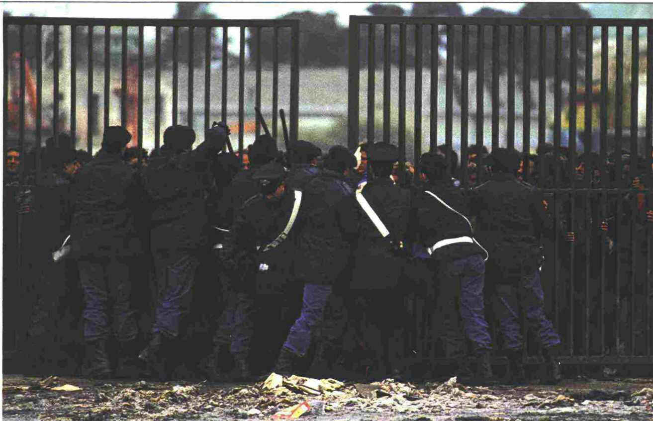
Un cordone di polizia e carabinieri prova ad arginare la folla di albanesi appena arrivati a Brindisi

suo fratello, ingegnere civile, li incontro per caso, riferiscono voci di navi in partenza da Durazzo verso l'Italia. Un camion ci porta lì in un'ora, il soldato che ci dovrebbe fermare butta via il fucile e salta con noi sul cargo: nessuno chiede soldi, nessuno paga, è una fuga, non un traffico di esseri umani. Sono le 2 di pomeriggio. Ci spareranno, ci arresteranno? Qualcuno lascia, noi aspettiamo. Notte all'addiaccio, macchine spente. Solo alle 6 di mattina del giorno dopo, il fatidico 7 marzo, la Legend molla gli ormeggi e con una lentezza esasperante comincia il suo viaggio. Il mare è calmo, la giornata calda, a lungo ci accompagnano i delfini. Verso mezzogiorno uno scoppio di euforia, "libertà, libertà", le dita a V di vittoria: siamo entrati in acque internazionali». In tasca Astrid ha un oggetto proibito sotto il regime: mai sentito il nome di Madre Teresa di Calcutta, albanese e Nobel per la pace, ma tre giorni prima quel-