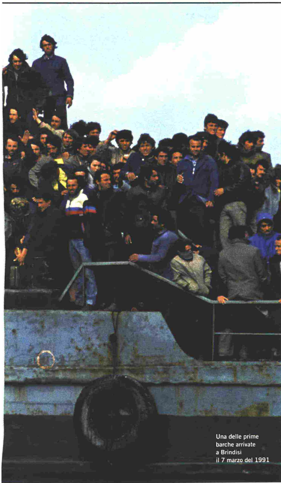
Una delle prime barche arrivate a Brindisi il 7 marzo del 1991