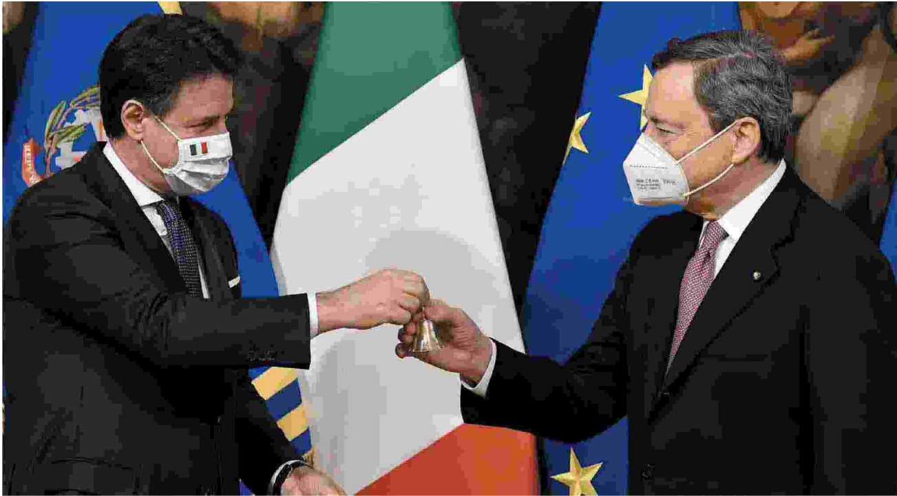
La cerimonia della campanella ha sancito ieri il passaggio della guida del governo da Giuseppe Conte a Mario Draghi