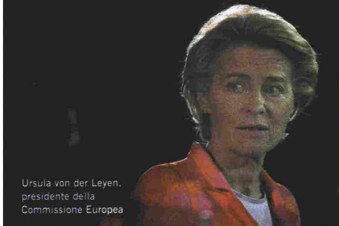
Ursula von der Leyen, presidente della Commissione Europea