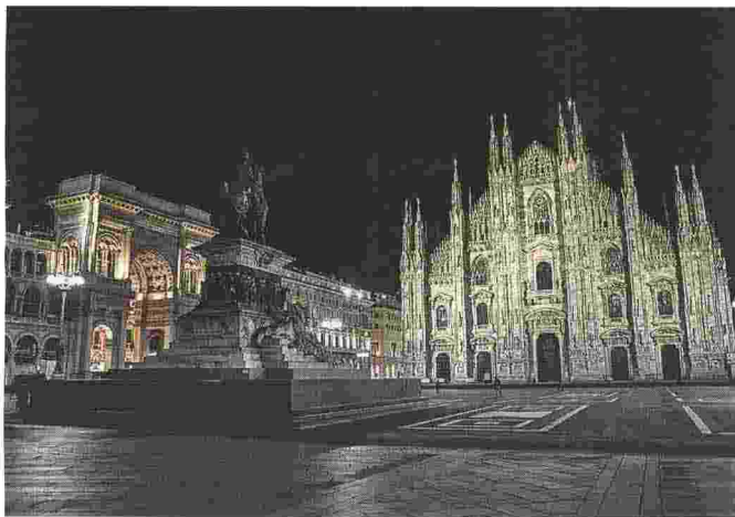
10 marzo 2020 Prima sera del lockdown nazionale: piazza Duomo, a Milano, è deserta