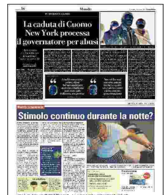
▲ Andrew Cuomo, 63 anni, governatore democratico dello Stato di New York