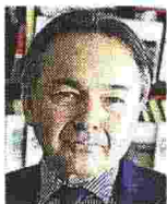
Lo studioso Gilles Kepel è un politologo, arabista e filosofo francese

Sul sito del «Corriere della Sera» tutti gli aggiornamenti, le immagini e le analisi sul viaggio del Papa in Iraq