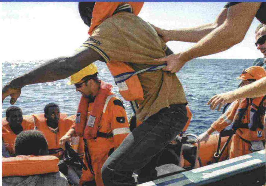
Le operazioni di trasbordo in mare di un gruppo di migranti soccorsi dalle organizzazioni umanitarie che operano nel Mediterraneo

«È così. Perciò l'attività di "ricerca e soccorso", che io ho svolto con altri a lungo, non consiste solo nel salvare persone in difficoltà. Siamo una crepa nella fortezza Europa. E