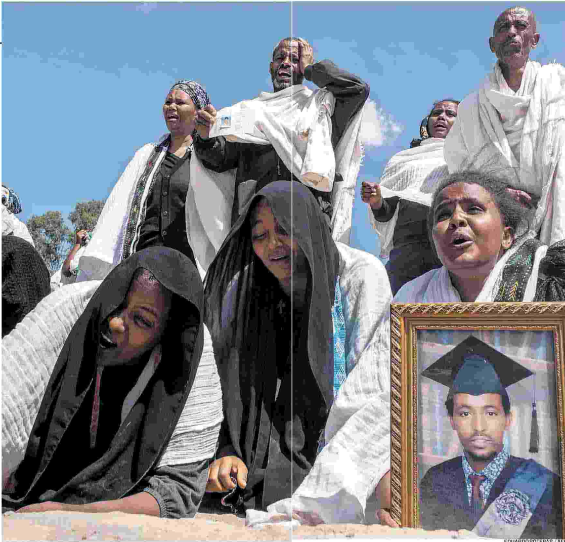
EDUARDO SOTERAS / AFP