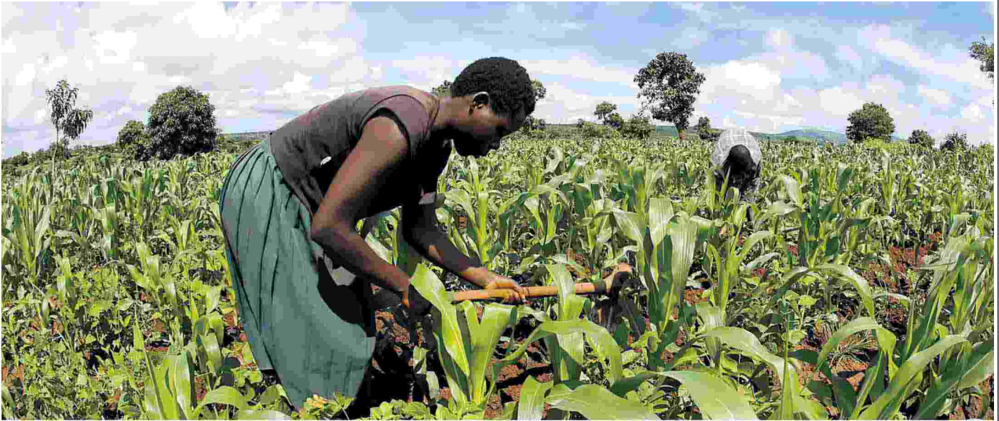
Contadini al lavoro in un campo di mais in Malawi. Tra siccità e alluvioni, con pochi e poveri mezzi agricoli, lavorare la terra in Africa è durissimo