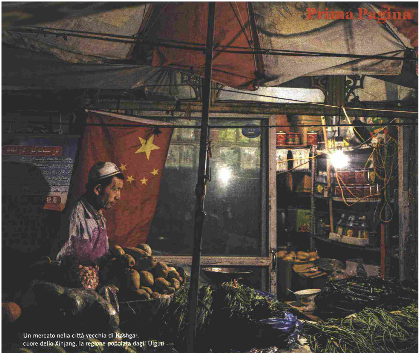
Un mercato nella città vecchia di Kashgar, cuore dello Xinjiang, la regione popolata dagli Uiguri

partito comunista. Sono rimasti una comunità arretrata, legata alla terra, alla religione e alle tradizioni. Quando hanno cercato di rafforzare le proprie radici culturali nei primi anni Duemila i cinesi hanno risposto con l'oppressione. Sono seguite le sommosse di Urumqi nel 2009 e l'auto bomba a piazza Tiananmen nel 2014. «Una situazione inaccettabile per un partito totalitario che vede come minaccia al proprio potere qualsiasi comunità, credo o ideologia alternativa», dice Zenz. Così nel 2016 il presidente Xi Jinping invia nello Xinjiang Chen, il governatore che domò col sangue le proteste tibetane del marzo 2008. Prima mossa: l'assunzione di centomila poliziotti e la costruzione di settemila stazioni di polizia in dodici mesi. Seconda mossa: l'apertura dei campi di rieducazione e dei campi di lavoro forzato (pubblicizzati nel resto della Cina come dorate opportunità lavorative per gente rozza e ignorante) in cui sono entrati circa 1,8 milioni di uiguri, quasi un quinto dell'intera popolazione. Infine, Chen crea scuole-dormitorio destinate a uniformare al credo