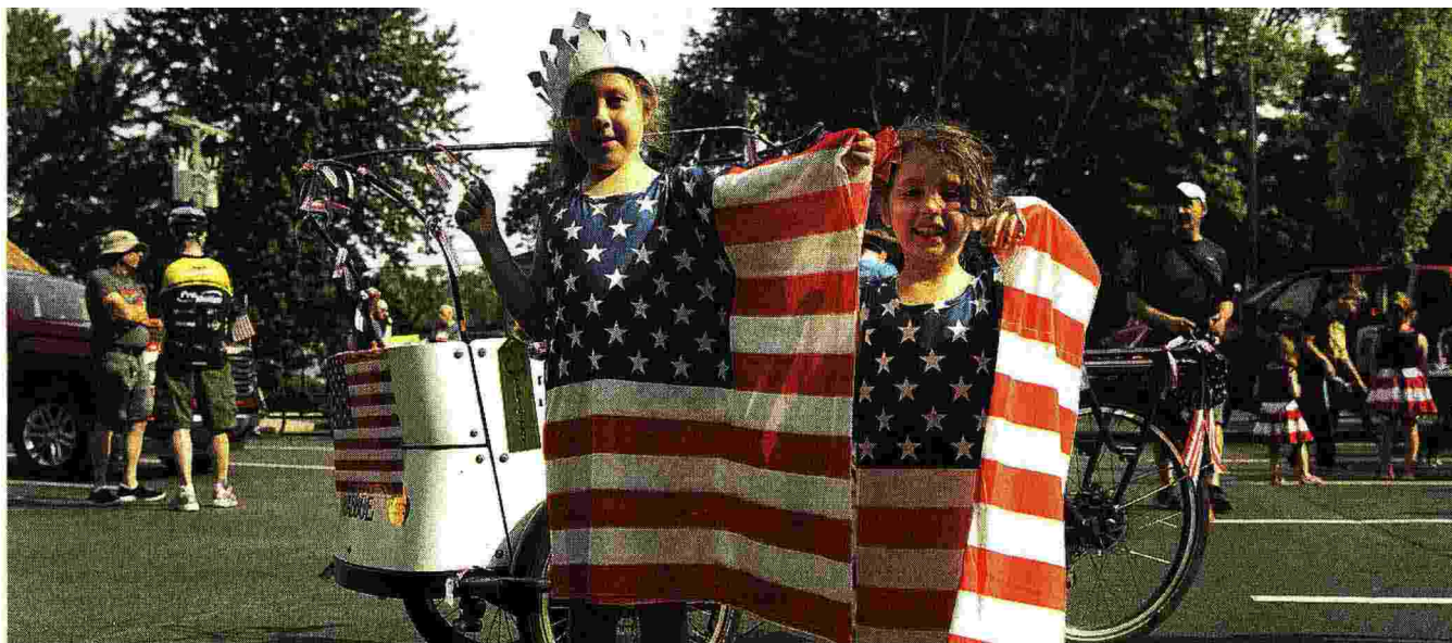
La parata Due bambine partecipano alla parata del 4 luglio di Brighton, in Michigan: la festa dell'Indipendenza è stata celebrata per la prima volta dall'inizio della pandemia

Da simbolo di unità la bandiera Usa è diventata un simbolo di divisione? Lo chiede il New York Times , notando che dal 1777 la bandiera a stelle e strisce ha significato molte cose. Sollevata a Iwo Jima in segno di vittoria, bruciata alle proteste per il Vietnam, avvolta alle Torri Gemelle nelle spille in memoria dell'11 settembre. Ma oggi alcuni pensano che se esibisci la bandiera sull'uscio o in auto, sei di destra. Molti progressisti sentono che la destra sta cercando di renderla un proprio simbolo. Il fatto che il quotidiano ponga queste domande il 4 luglio è inaccettabile per Fox e altri conservatori: «È il Times che è divisivo».