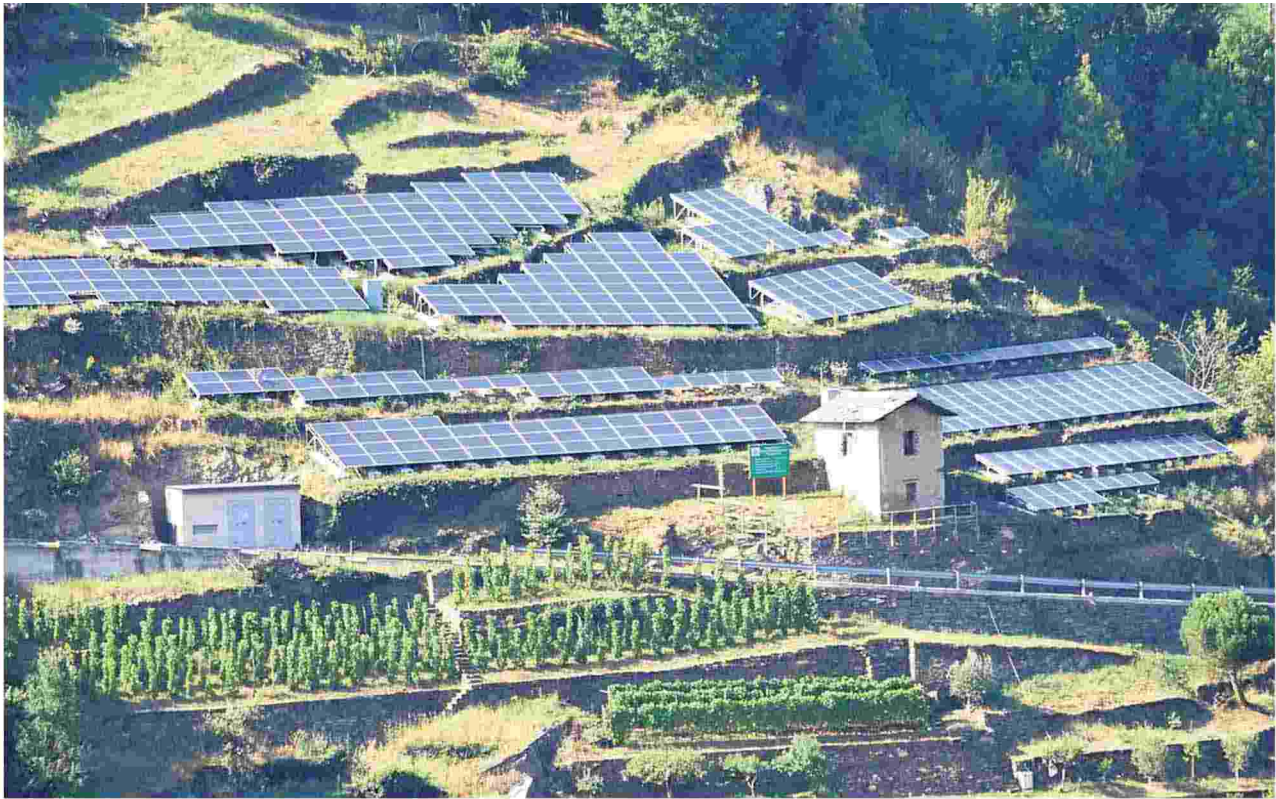
Molti paesaggi italiani sono il frutto di uno stretto e secolare legame tra natura e cultura, ma oggi la loro tutela appare sempre più spesso a rischio