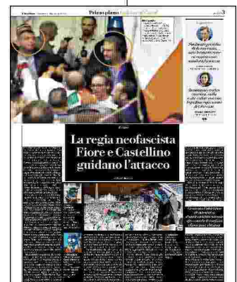
▲ Sul palco Giuliano Castellino, leader di Forza Nuova, ieri a Roma in piazza del Popolo alla manifestazione No Pass sfociata negli scontri