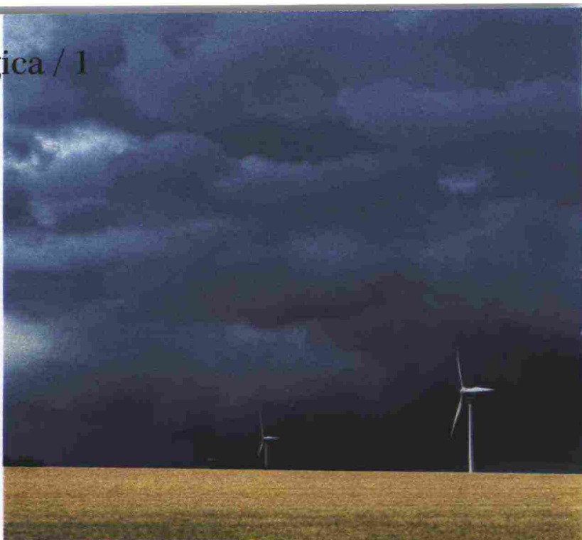
Germania. Una perturbazione passa sopra le pale eoliche nella campagna intorno ad Hannover

«Una reale transizione verso una società a zero emissioni deve poggiare su quattro assi: la sostituzione dei combustibili fossili con fonti di energia rinnovabile, il rinnovamento termico degli edifici, la mobilità verde, la trasformazione dell'industria e dell'agricoltura verso modelli meno energivori. Questa transizione costa moltissimo. Con i vincoli imposti dal trattato di Maastricht per la riduzione del debito pubblico, gli Stati oggi non hanno i mezzi per finanziare un cambiamento così radicale. Io lo dico da tempo: non ci sarà mai un autentico green new deal europeo fintanto che non rivedremo radicalmente i meccanismi di funzionamento dell'Unione europea e