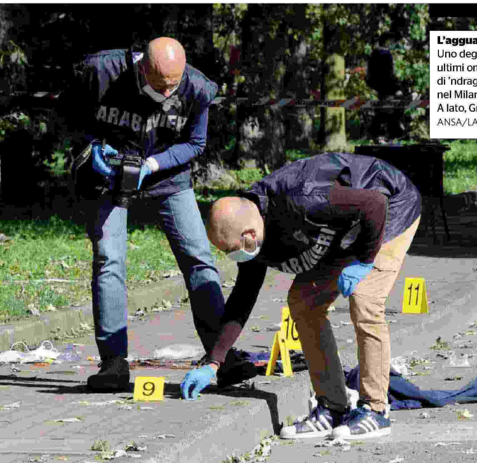
L'agguato Uno degli ultimi omicidi di 'ndragheta, nel Milanese. A lato, Gratteri