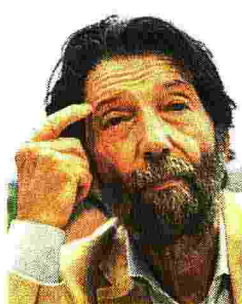
Filosofo Massimo Cacciari, 77 anni, è stato anche sindaco di Venezia