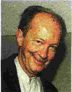
Accademico Il filosofo Giorgio Agamben, 79 anni, ha insegnato a Parigi e Venezia