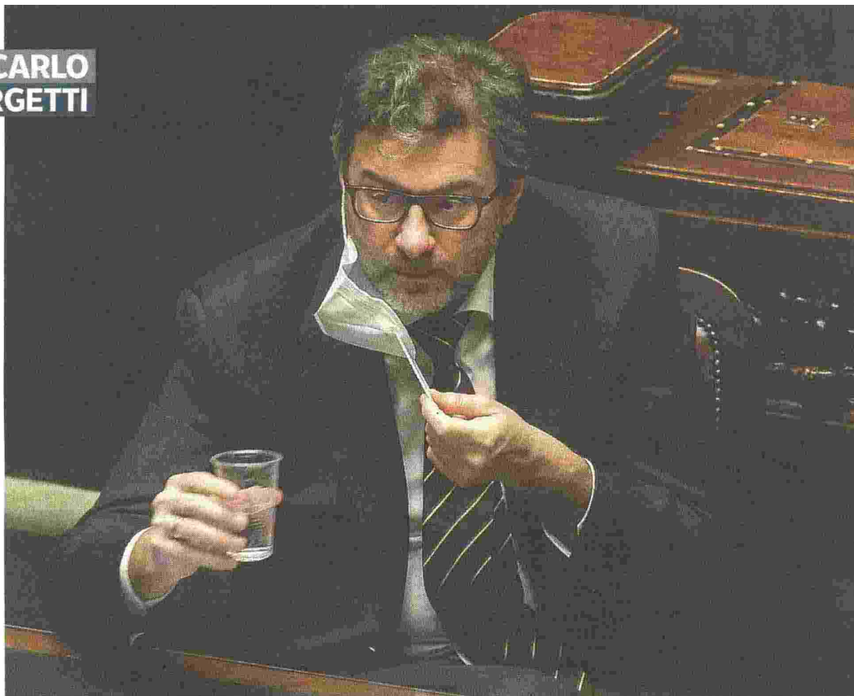
Ministro per lo Sviluppo economico Giancarlo Giorgetti, 55 anni, della Lega, è ministro del governo Draghi dal 13 febbraio del 2021