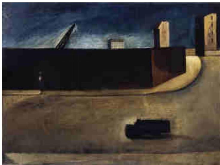
Mario Sironi, Paesaggio urbano con camion , 1919-1920, olio su tela, cm. 44x60, Milano, Galleria di Brera

Un semovente nero che incede in uno spazio siderale, attraversa quanto di ineluttabile possa accogliersi in un rettilineo di periferia, ora che ha portato a termine la sua missione e fila dritto al cuore della città. Sul finire del 1918 tacciano le armi sui fronti d'Europa.