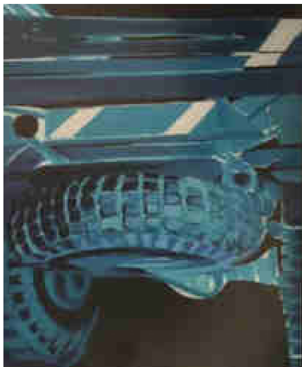
Titina Maselli, Camion blu , 1966, acrilico su tela, cm. 117x60, Roma, collezione privata.

I pneumatici ben aderenti all'asfalto, là dove la strada corre come un nastro, i chilometri annullati dalla potenza del motore a pieno regime che cancella le distanze segnate sulle carte stradali. Camion che procedono sicuri, nel ritmo regolare dei pistoni. Verso dove vanno quei camion? Hanno una meta da raggiungere? Titina è affascinata dal loro andare.