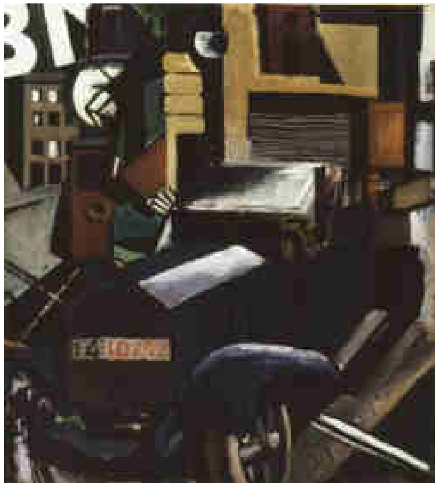
Mario Sironi, Il camion , 1914, olio su tavola, cm. 90x80, Milano, Galleria di Brera

La scomposizione futurista apparenta parafranghi, portiere e muri, crea una scansione che mette capo ad un accumulo di "lastre" fino ad occupare intera l'immagine.