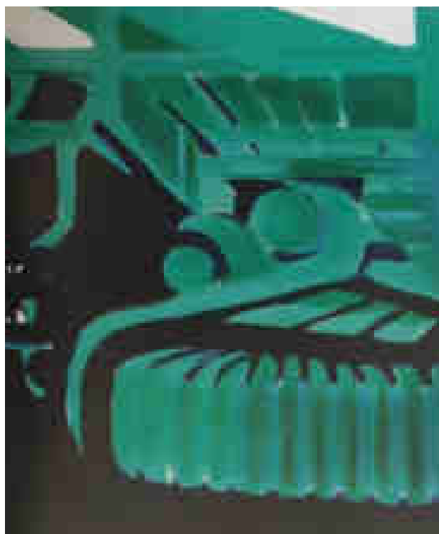
Titina Maselli, Camion verde nero , 1983, acrilico su carta, cm. 70x50, Roma, collezione privata.