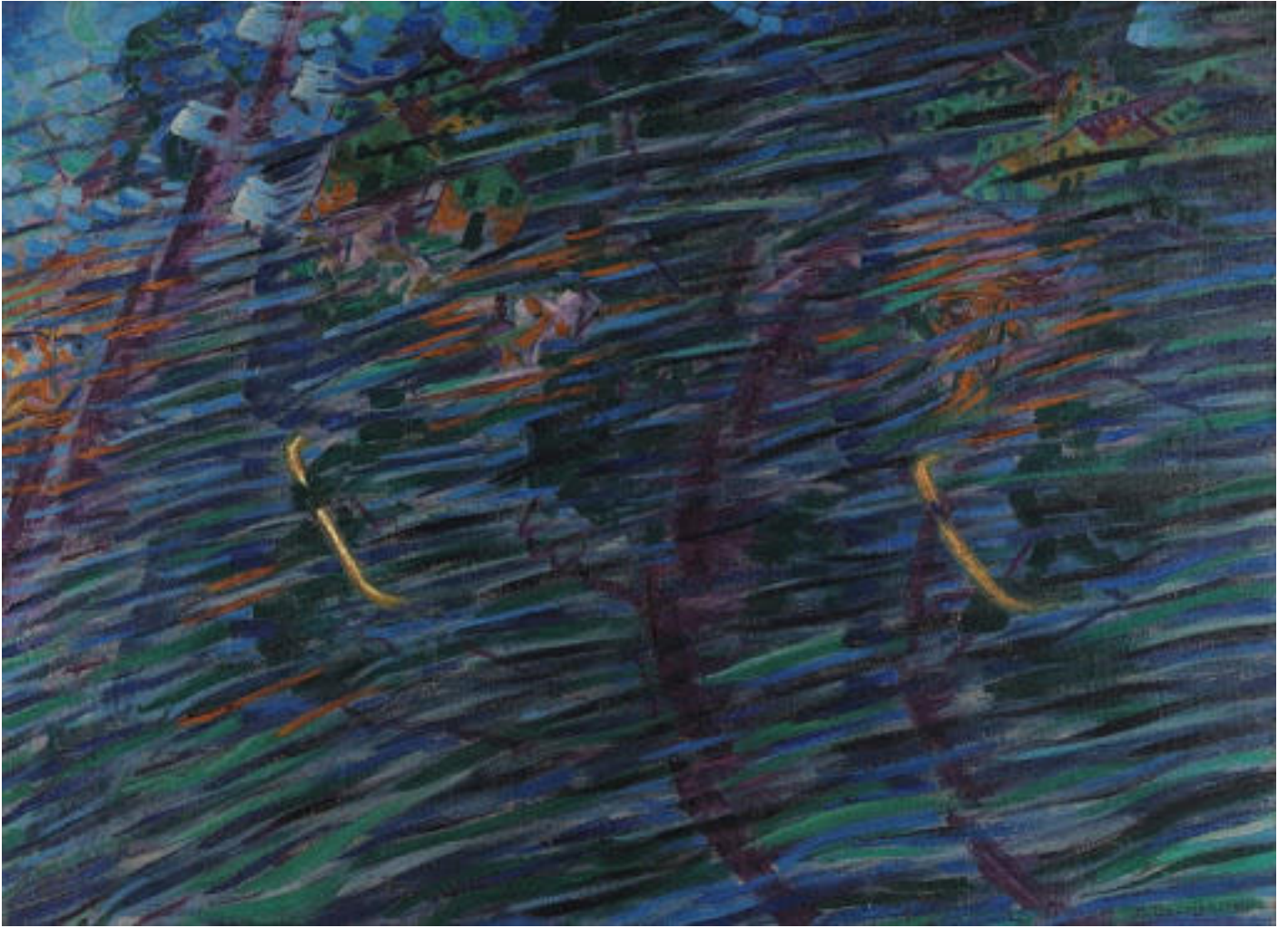
Umberto Boccioni, Stati d'animo. II. Quelli che vanno , 1911 (olio su tela, 70x96 cm.).