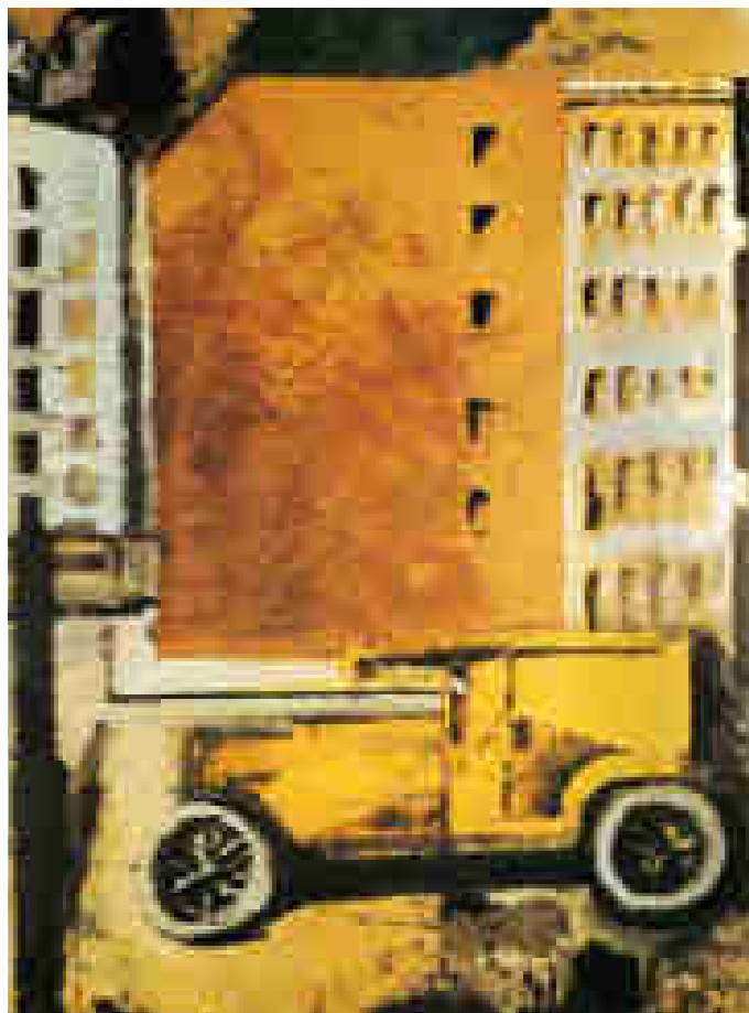
Mario Sironi, Il camion giallo , 1919, tempera e collage su carta applicata su tela, cm. 89x63

Camion e città si compenetrano e rimandano suoni metallici.