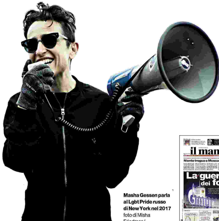
Masha Gessen parla al LGBT Pride russo di New York nel 2017

pensiero confrontarsi sulla sua essenza identitaria e sulla sua missione storica», siano spesso prevalsi nel Paese «i promotori di una qualche forma di Idea Russa, cioè di un percorso speciale e nazionalista di sviluppo, basato su specifici valori e specifiche istituzioni distanti o diverse dall'Occidente. Secondo alcune interpretazioni, la stessa Urss, nella sua versione stalinista, avrebbe in qualche modo riproposto una forma sovietica di Idea Russa». Del resto, anche la svolta conservatrice di Putin «può essere considerata a tutti gli effetti come la riproposizione di una nuova forma di Idea Russa: un contenitore di proposte conservatrici funzionali a un disegno patriottico di sovranità politica, di autocoscienza nazionale e di riaffermazione di un ruolo di grande potenza sullo scenario globale. Un progetto fondato su una visione tradizionalista della storia, della cultura e degli interessi della Russia».