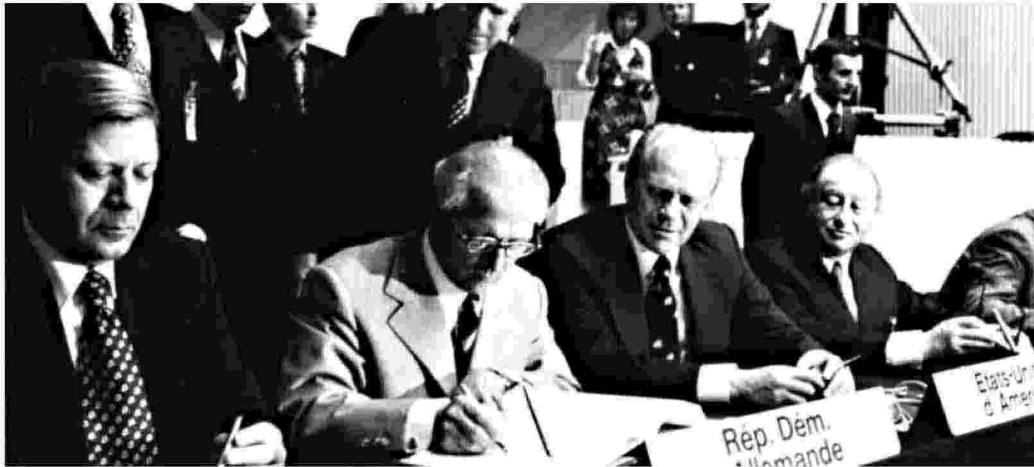
La firma dei trattati di Helsinki, 1975. Nella foto, Erich Honecker, Germania est, Gerald Ford, Usa, Bruno Kreisky, Austria