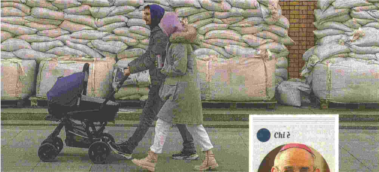
A passeggio Una coppia con il passeggino davanti a un negozio protetto da sacchi di sabbia a Dnipro, Ucraina