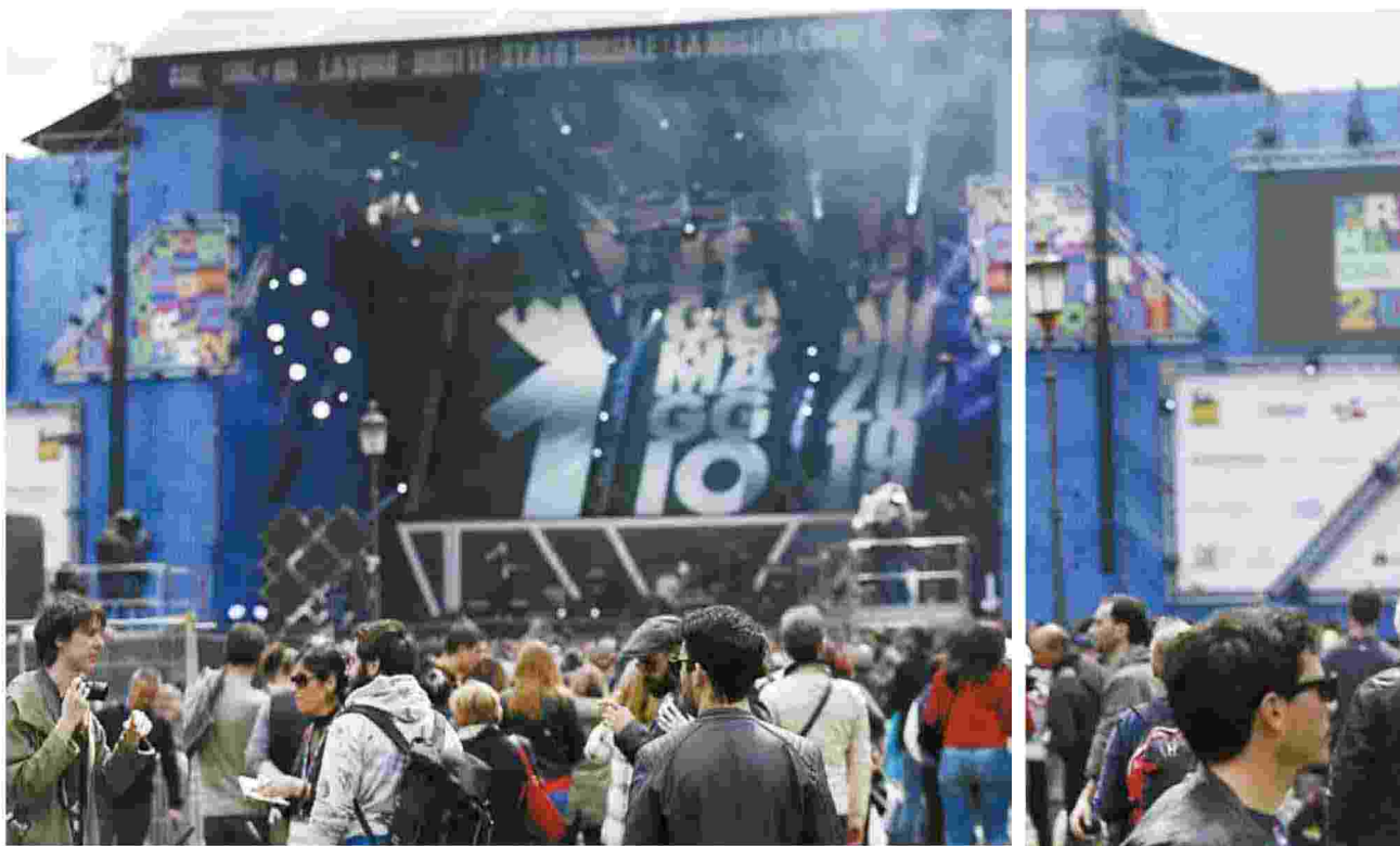
2019, l'edizione del concertone di San Giovanni prima della pandemia

E oggi a Roma torna il «concertone» promosso dai Cgil, Cisl e Uil. Dalle 15 in poi dal palco di piazza San Giovanni si alterneranno oltre 30 artisti. Mentre a Milano la Mayday del lavoro precario risorge al femminile, «Primaggia». CRIPPA, FRANCHI E MAGGIONIA PAGINA 6 E 7