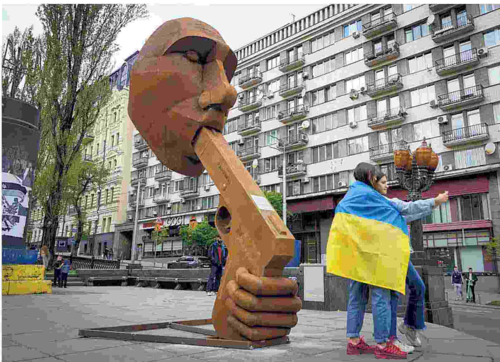
Una nuova installazione artistica apparsa a Kiev: l'opera ritrae il volto di Putin con una pistola alla bocca