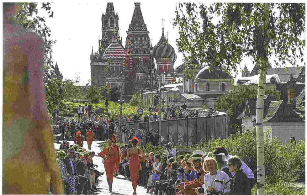
Passerella Modelle sfilano a Mosca, poco lontano dalla Piazza Rossa, indossando capi firmati da una stilista russa. Sullo sfondo, San Basilio

La città isolata sul Baltico La nostra risposta? Non deve essere necessariamente simmetrica